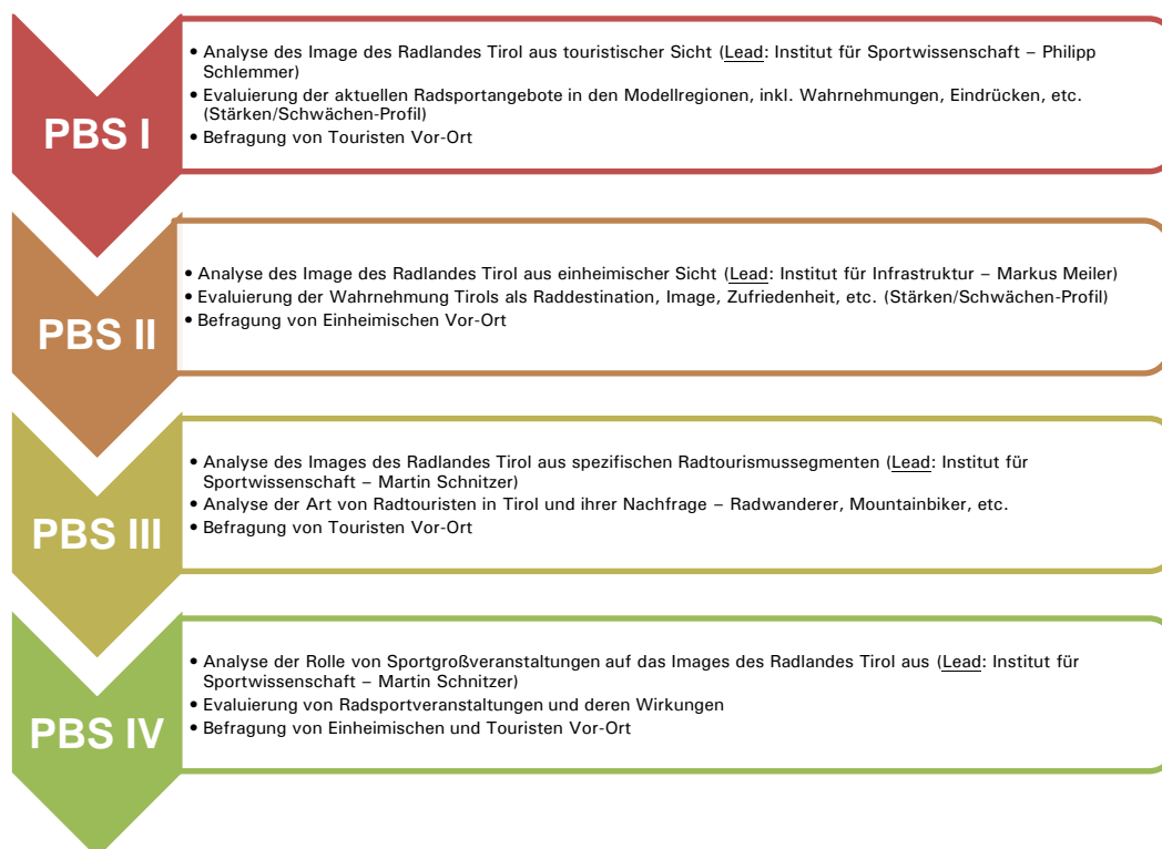
Abbildung 1: Studiendesign Imagestudie zum Radland Tirol

Das Forschungsprojekt wurde von einer interdisziplinären Arbeitsgruppe, bestehend aus zwei Instituten von verschiedenen Fakultäten der Leopold-Franzens-Universität Innsbruck (LFU) ausgearbeitet. Die Zusammensetzung der Arbeitsgruppe gewährleistet eine breite methodische und fachliche Kompetenz. Zur Unterstützung des Projekts wurden zwei Kooperationspartner gewonnen, die in der Umsetzung des Projekts mit ihrem touristischen Netzwerk operativ und finanziell unterstützend tätig sind. Für das vorliegende Projekt wurde ein mehrschichtiger Erhebungsplan entwickelt, welcher sich aus vier Projektbausteinen zusammensetzt, welche jeweils verschiedenen Teilbereiche des Forschungsprojektes abdecken (siehe Abb. 1).